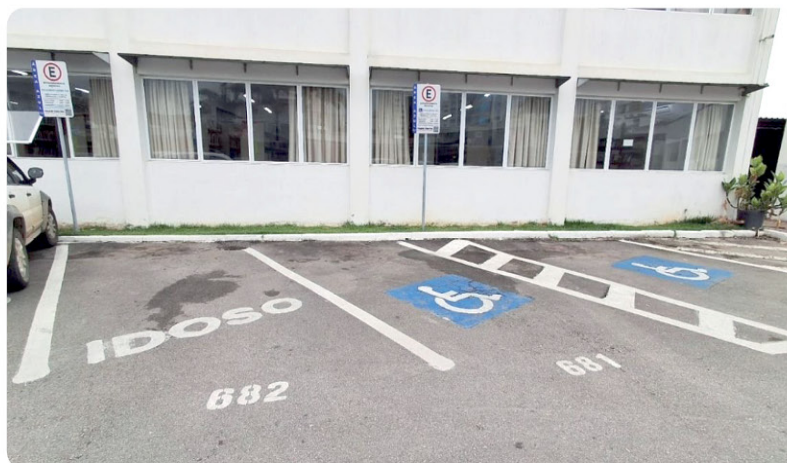
Vagas da Área Azul garantidas à idosos e pcds

SETOR DEPARTAMENTO DE COMPRAS E LICITAÇÕES MODO DISPUTA ABERTO OBJETO: SELEÇÃO DE EMPRESA PARA ELABORAÇÃO DE PROJETO E CONSTRUÇÃO DE 24 UNIDADES HABITACIONAIS (APARTAMENTOS) NO LOTEAMENTO CIDADE JARDIM, NESTE MUNICÍPIO, POR MEIO DO FUNDO DE ARRENDAMENTO RESIDENCIAL (FAR), DO PROGRAMA MINHA CASA, MINHA VIDA, CONFORME ESPECIFICAÇÕES DISPOSTAS NESTE TERMO DE REFERÊNCIA RECEBIMENTO DE PROPOSTAS: A partir de 02/12/2025 até o dia 17/12/2025. LOCAL DA SESSÃO PÚBLICA: na Plataforma Licit Digital, no endereço eletrônico: https://licitar.digital/ . REFERÊNCIA DE TEMPO: todas as referências de tempo no Edital, no Aviso e durante a Sessão Pública observando, obrigatoriamente, o horário de Brasília/DF. VALOR ESTIMADO DA CONTRATAÇÃO: R$ 3.792.000,00 (três milhões setecentos e noventa e dois mil reais) REGIMENTO: Edital e seus anexos, e nos termos da Lei Federal nº 14.133, de 1º de abril de 2021, com alterações posteriores e Decreto Municipal nº 1.103/2024, e portarias MCID 47/2025, 488/2025, 489/2025, 724/2025 e 725/2025. MAIORES INFORMAÇÕES: O edital na íntegra e todos os seus anexos, estão à disposição no site www.ilhota.sc.gov.br e https://licitar.digital/ , como também contatos alternativos para eventuais dúvidas - Telefone: (047) 3343-8800 ou ramal 8826. Horário de Expediente da Prefeitura: Das 08:00 às 12:00 e 13:00 às 17:00. CARLOS EDUARDO SCHMITT SECRETÁRIO DE ADMINISTRAÇÃO Ilhota, 02 de dezembro de 2025.