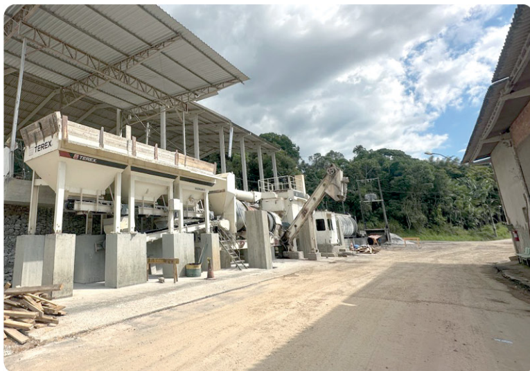
Estrutura fica na Paquetá

O secretário explica que testes do material garantem a quali-