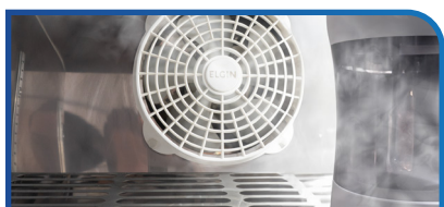
CONTROLE DA UMIDADE