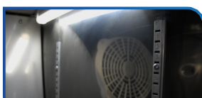
GABINETE EM AÇO INOX

O controlador de umidade, tem a função de simular condições controladas de temperatura e umidade para plantas e sementes. Criando um ambiente propício para atividades microbianas, garantindo resultados consistentes.