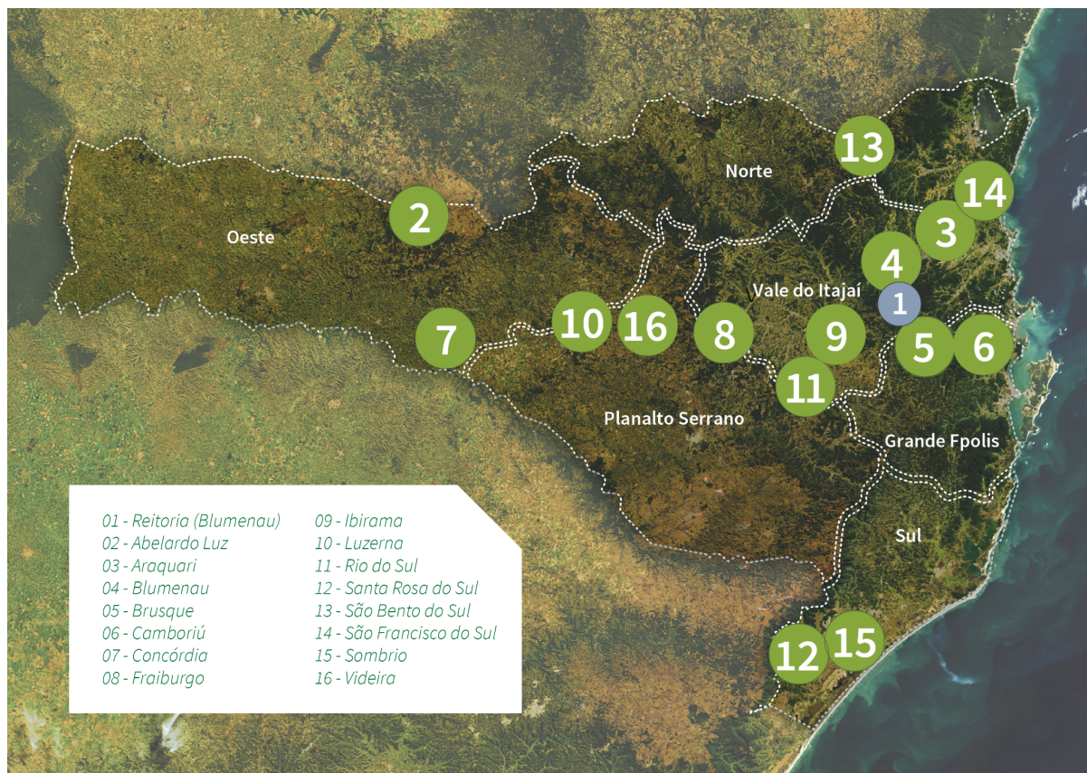
Figura 01: Mapa de abrangência institucional do IFC (pdi)

O Instituto Federal Catarinense tem como diretrizes institucionais: