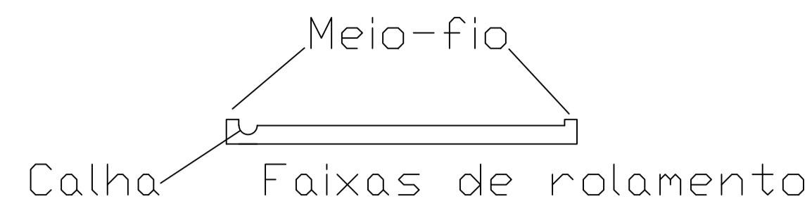
Camadas de Pavimentação