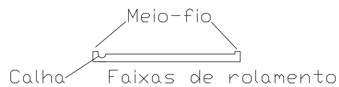
Camadas de Pavimentação